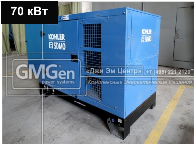
Электростанция KOHLER-SDMO J88K в кожухе для строительной компании