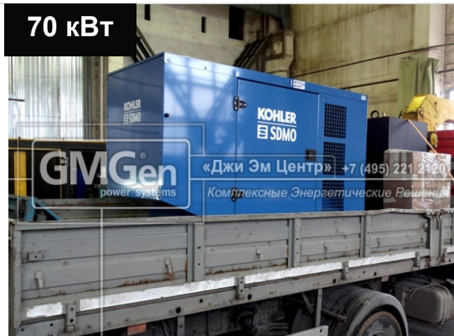
Электростанция KOHLER-SDMO J88K в кожухе для торгового центра