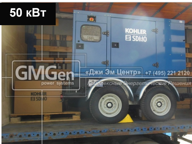
Электростанция KOHLER-SDMO J66K в кожухе на шасси для строительной компании