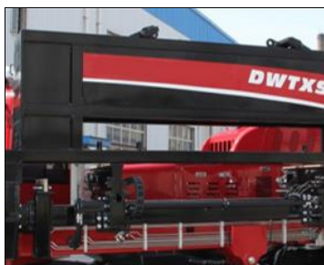
Ёмкость кассеты для буровых штанг 40шт