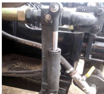
Гидрозатвор бентонитовой магистральной.