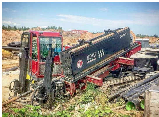
ФОТО УСТАНОВКИ DDW36/13 НА СТРОИТЕЛЬНЫХ ОБЪЕКТАХ

! Все необходимые запчасти и буровой инструмент всегда в наличии на складе в Москве.