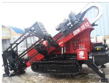
Максимальный угол забурирования.