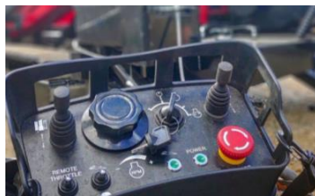
Выносной пульт управления движением