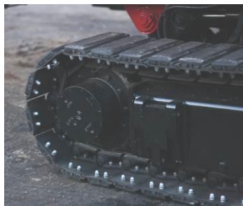
Металлические гусеницы с резиновыми вставкам