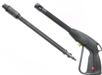
Оснащение промывочным пистолетом