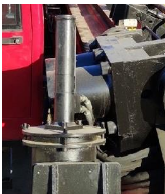
Автоматическая система смазки штанг