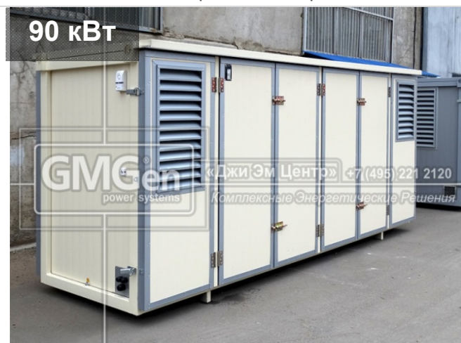
Электростанция KOHLER-SDMO J110K в мини-контейнере для метеостанции