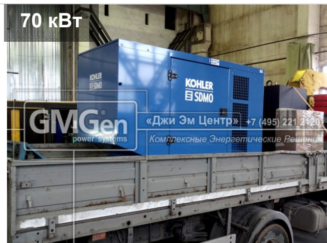
Электростанция KOHLER-SDMO J88K в кожухе для торгового центра