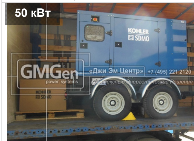
Электростанция KOHLER-SDMO J66K в кожухе на шасси для строительной компании