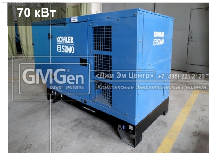
Электростанция KOHLER-SDMO J88K в кожухе для строительной компании